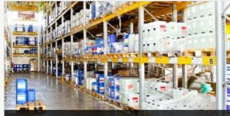
ใบแจ้งการดำเนินการมีวีครอบครองวัตถุอันตรายชนิดที่ 2