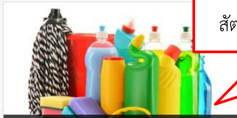
ใบรับรองการขึ้นบัญชีหรือผลิตภัณฑ์ให้ใช้ในโรงฆ่าสัตว์และโรงงานแปรรูปผลิตภัณฑ์สัตว์เพื่อกา...

ใบรับรองการขึ้นบัญชีหรือผลิตภัณฑ์ที่อนุญาตให้ใช้ในโรงฆ่าสัตว์และโรงงานแปรรูปผลิตภัณฑ์สัตว์ หรือ สม./กปศ.2