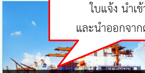
ใบแจ้ง นำเข้า/ส่งออก และนำออกจากด่านศุลกากร