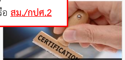
หนังสือรับรองการขาย Certificate of Free Sale วัตถุอันตราย