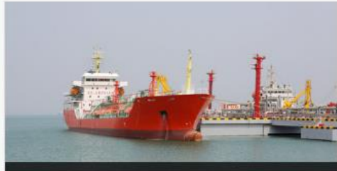
ใบแจ้งการดำเนินการส่งออกวัตถุดิบรายชนิดที่ 2