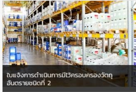
ใบแจ้งการดำเนินการมีวีครอบครองวัตถุอันตรายชนิดที่ 2