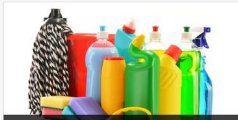
ใบรับรองการขึ้นบัญชีหรือผลิตภัณฑ์ที่ใช้ในโรงฆ่าสัตว์และโรงงานแปรรูปผลิตภัณฑ์สัตว์เพื่อกา...