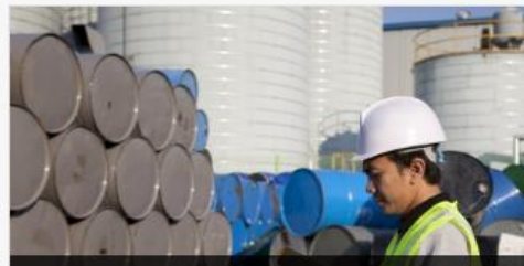
ใบแจ้งปริมาณการผลิตวัตถุอันตราย ชนิดที่ 2 และ ชนิดที่ 3