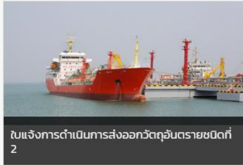
ใบแจ้งการดำเนินการส่งออกวัตถุดิบรายชนิดที่ 2