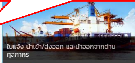
ใบแจ้ง นำเข้า/ส่งออก และนำออกจากด่านศุลกากร