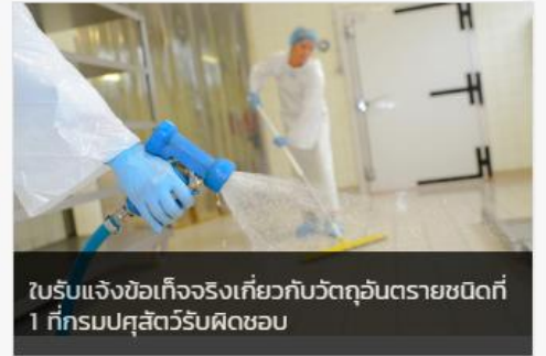
ใบรับแจ้งข้อเท็จจริงเกี่ยวกับวัตถุอันตรายชนิดที่ 1 ที่กรมปศุสัตว์รับผิดชอบ