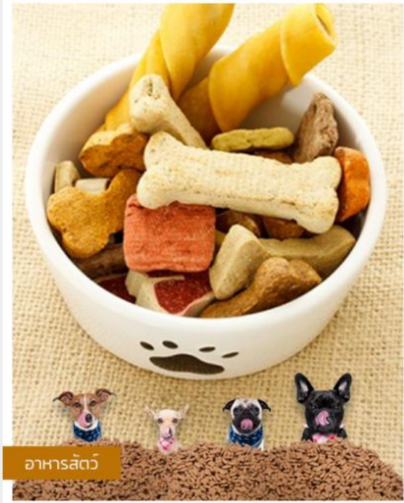
อาหารสัตว์

กรมปศุสัตว์ Department Of Livestock Development