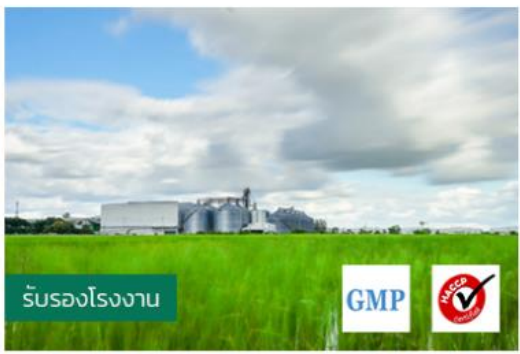
รับรองโรงงาน