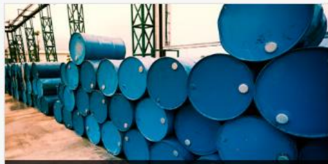
บันทึกปริมาณการผลิตหรือปริมาณการนำเข้าซึ่งวัตถุอันตรายชนิดที่ 1 ที่กรมปศุสัตว์รับผิดชอบ