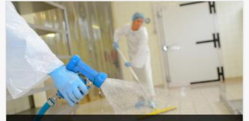
ใบรับแจ้งข้อเท็จจริงเกี่ยวกับวัตถุอันตรายชนิดที่ 1 ที่กรมปศุสัตว์รับผิดชอบ