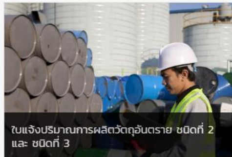
ใบแจ้งปริมาณการผลิตวัตถุอันตราย ชนิดที่ 2 และ ชนิดที่ 3