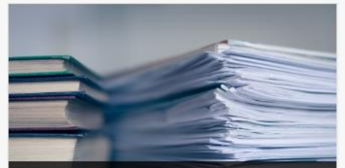
หนังสือมอบอำนาจ (สำหรับวัตถุอันตรายที่อยู่ใความรับผิดชอบของกรมปศุสัตว์)