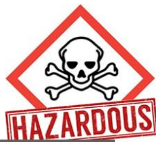
วัตถุอันตรายด้านการปศุสัตว์