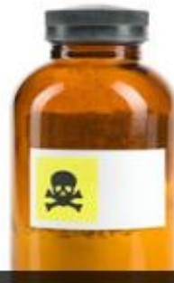
นำเข้าตัวอย่างวัตถุอันตราย