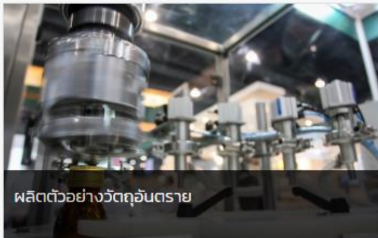
ผลิตตัวอย่างวัตถุอันตราย